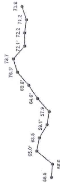
Percepción de inseguridad en el municipio o demarcación territorial

2011 2012 2013 2014 2015 2016 2017 2018 2019 2020 2021 2022 2023 2024