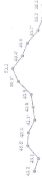
Percepción de inseguridad en la colonia o localidad

2011 2012 2013 2014 2015 2016 2017 2018 2019 2020 2021 2022 2023 2024